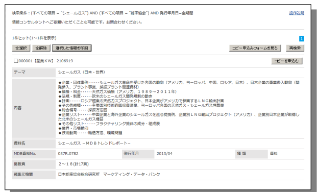
-検索結果表示画面-